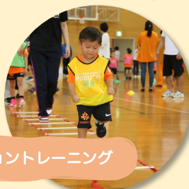
ビジョントレーニング

目で見たものを身体で表現する能力を高めるトレーニングです。運動の基礎づくりや苦手克服に役立ちます。