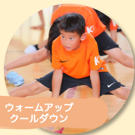
ウォームアップ クールダウン